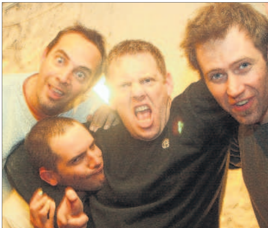
Les quatre membres des Dud, ils aiment : "Tout ce qui est rapide, court et sale... à l'inverse de nos habitudes conjugales d'ailleurs !".

C'est ainsi que sont nés les Dud, groupe aixois composé de Raph, NicoV, NicoD et Gro-Dave. Or ce pseudonyme du batteur brouille d'emblée les pistes puisque cette référence à Dave Grohl du groupe Nirvana nous éloigne des musiques préférées du Dude. Les Dud (le groupe) ont tenté de retranscrire l'insouciance du Dude (le personnage) dans une musique que le groupe définit lui-